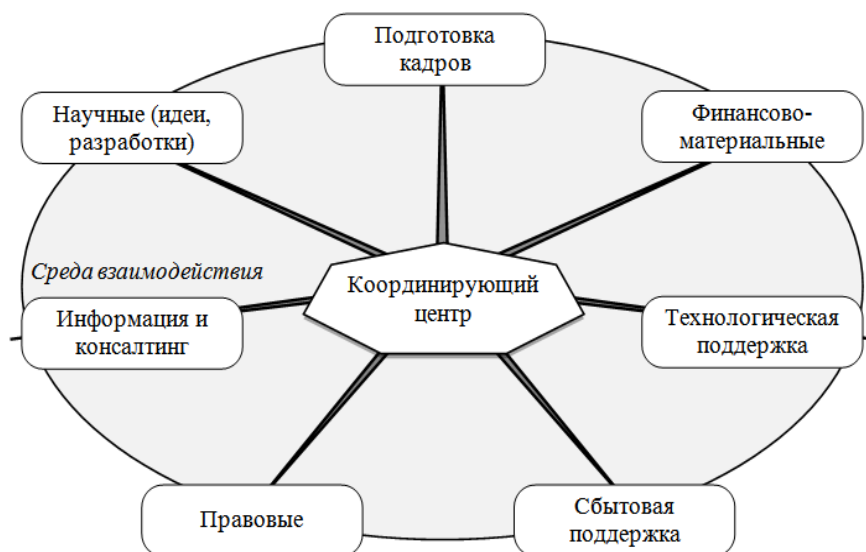
Рисунок 1 – Функционально-взаимосвязанная система развития инфраструктуры инновационной деятельности Республики

Следовательно, процесс формирования общей системы функционирования инфраструктуры инновационной деятельности имеет свой ряд особенностей и влияющих факторов в силу разнообразности и многосложности составляющих элементов (рис. 1) [2].