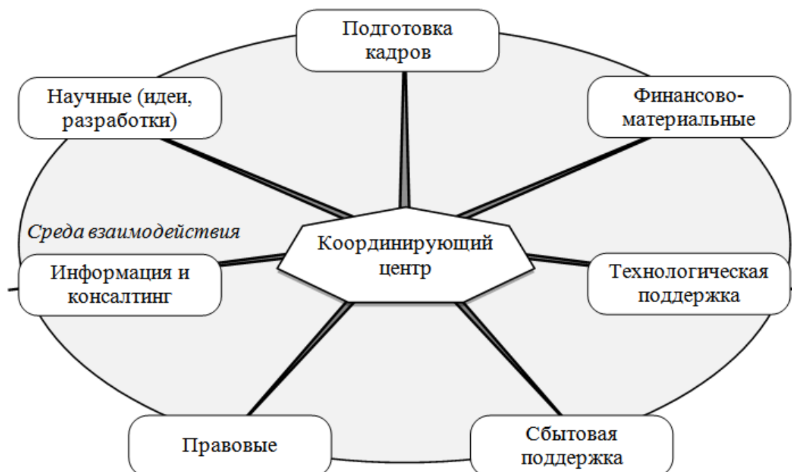
Рисунок 1 – Функционально-взаимосвязанная система развития инфраструктуры инновационной деятельности Республики

Следовательно, процесс формирования общей системы функционирования инфраструктуры инновационной деятельности имеет свой ряд особенностей и влияющих факторов в силу разнообразности и многосложности составляющих элементов (рис. 1) [2].