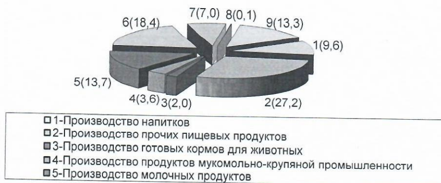
Рис. 1. Название рисунка

Текст. Текст. Текст. Текст. Текст. Текст. Текст. Текст. Текст. Текст. Текст. Текст.