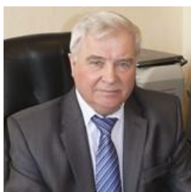
Ю.Ф. Лачуга, академик- секретарь отделения с.-х. наук РАН, академик РАН