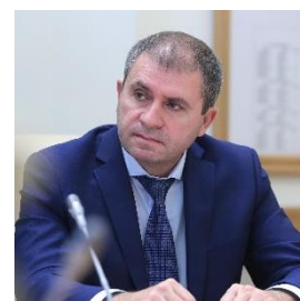
К.Н. Рачаловский, министр сельского хозяйства и продовольствия Ростовской области